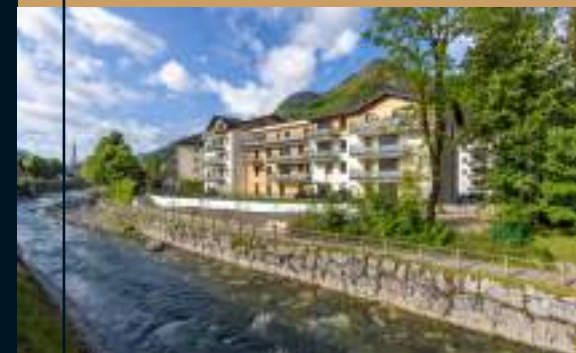
THÔNES (74) - Résidence INSITU livrée en Mai 2021