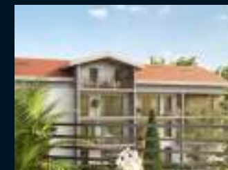
Architecture aux lignes douces pour plus d'authenticité