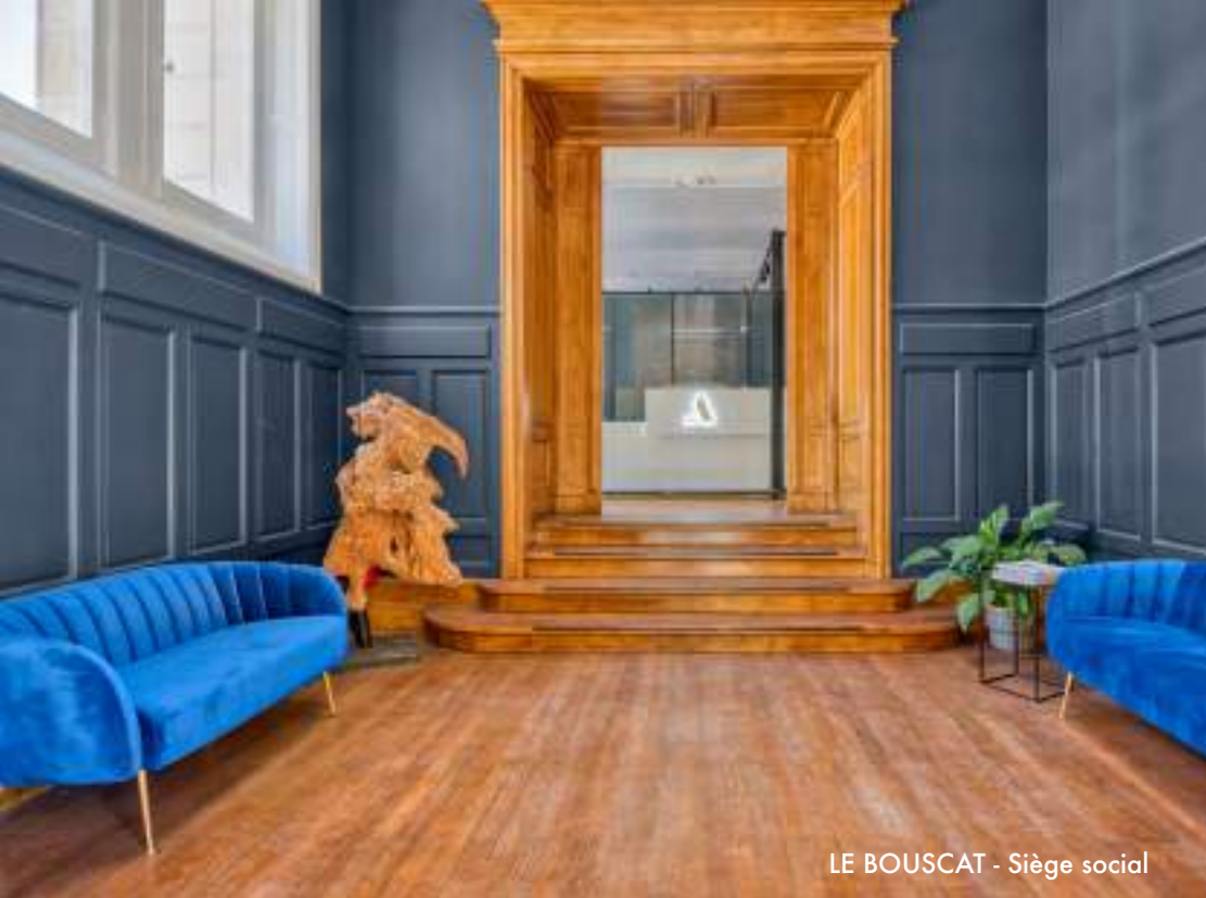
LE BOUSCAT - Siège social

Après 15 ans d'existence, le Groupe Anthélios est aujourd'hui un acteur majeur du marché immobilier.