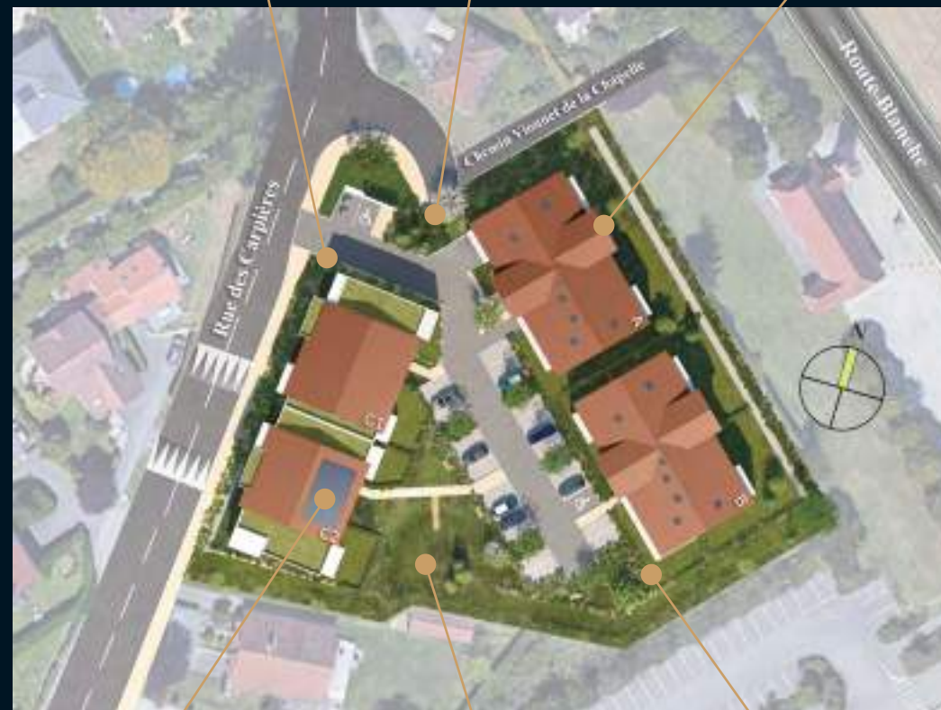
Panneaux solaires pour plus d'éco-responsabilité