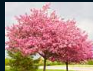
Espaces verts arborés pour plus de gaieté